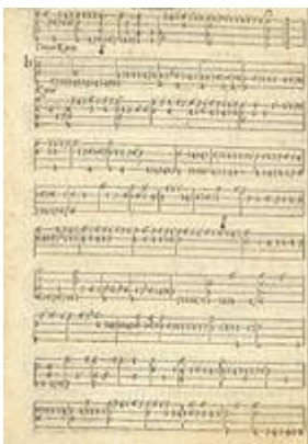
Tercer kyrie. Francisco Hernández Palero. Libro de cifra nueva para tecla, arpa y vihuela . Luis Venegas de Henetrosa (1557)