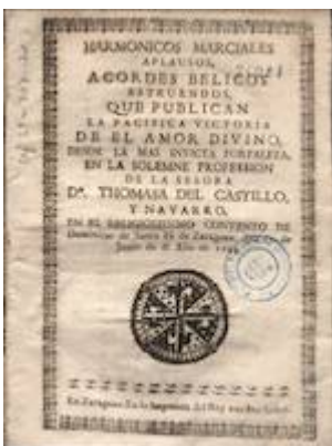
Harmónicos marciales aplausos. Zaragoza: Imprenta Real, 1744