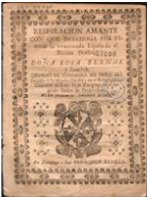
Respiración amante. Zaragoza: Francisco Revilla, 1736