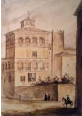
Convento de Santa Fe