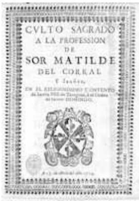
Culto sagrado. Zaragoza: s.n., 1714