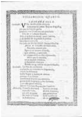
Holocausto de la caridad. Zaragoza: Francisco Revilla, 1731