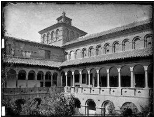
Claustro del convento de Santa Fe