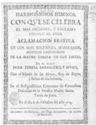
Harmoniosos himnos . Zaragoza: Diego Larumbe, 1713