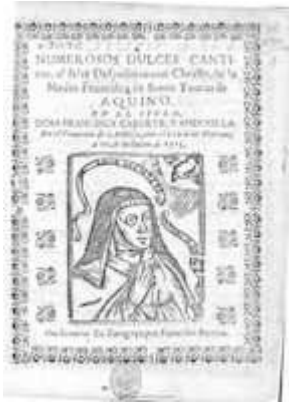
Numerosos dulces cánticos . Zaragoza: Francisco Revilla, 1713