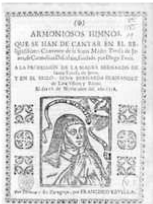
Armoniosos himnos . Zaragoza: Francisco Revilla, 1718