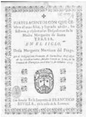
Suaves acentos . Zaragoza: Francisco Revilla, 1713