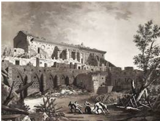
Vista del costado del convento de Santa Catalina en 1808. Juan Gálvez (dibujo) y Fernando Brambila (grabado). Cádiz, 1812