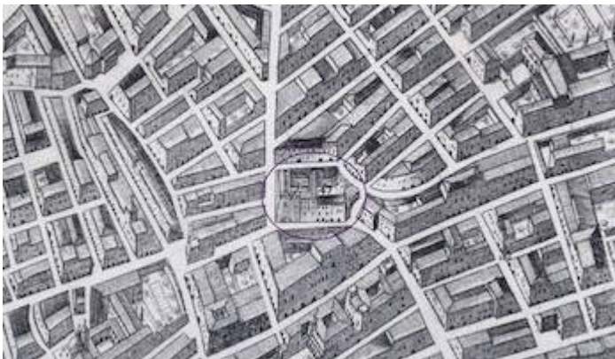
Convento de Nuestra Señora al Pie de la Cruz. Plano de Valencia. Tomás Vicente Tosca (1704)