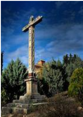
Cruz de los canteros y soldados de la Alhambra