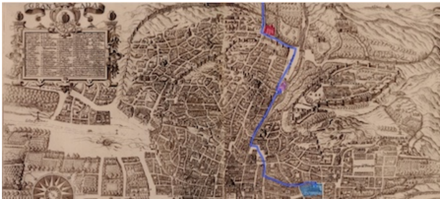
Itinerario del vía crucis del Sacromonte en la plataforma de Ambrosio de Vico