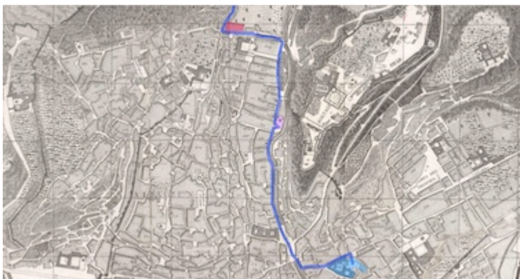
Itinerario del vía crucis del Sacromonte en el mapa de Francisco Dalmau