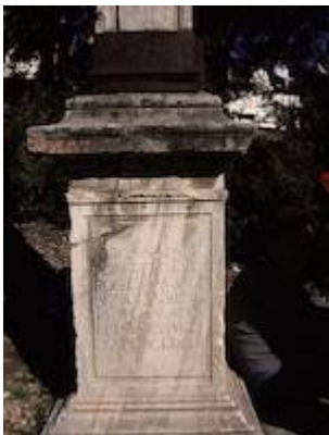
Cruz de los ganapanes (detalle)