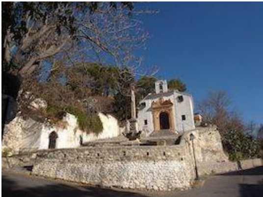
Ermita del Santo Sepulcro