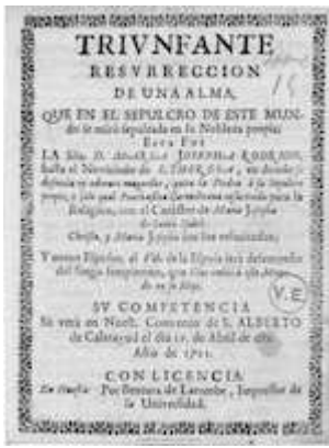
Triunfante resurrección de un alma.... Huesca: Ventura de Larumbe, 1721