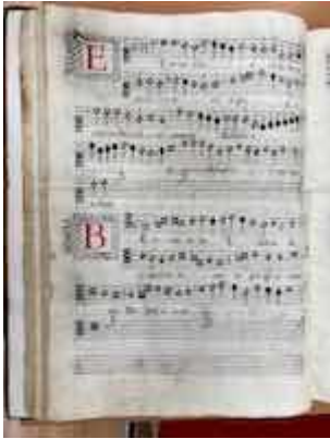
Beatus es et bene tibi erit. [E-GUA 7], fol. 40v

https://embed.spotify.com/?uri=https://open.spotify.com/track/7bFRIMalj1rq2s07GanQbF?si=kXAR_hRMRYuP_rahn7m9lg