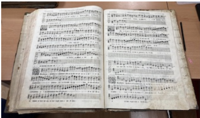
Missarum liber secundus (1582), fols. 112v-113r Francisco Guerrero