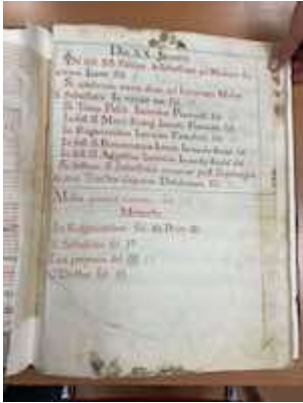
Index. Libro de coro con obras en canto llano y polifonía [E-GUA 7]