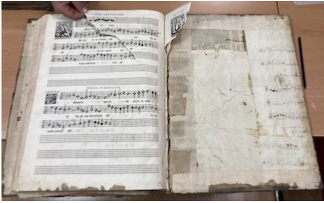
Missarum liber secundus (1582), fols. 119v-120r