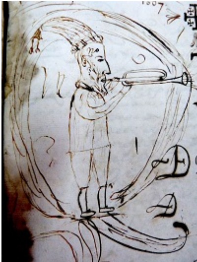
Libro de protocolos nº 31 de Alonso Sánchez de la Cruz