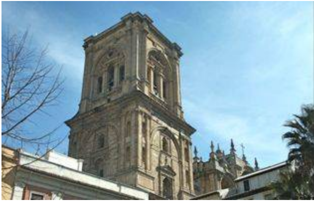
Sonidos de la fiesta del Corpus Christi. Granada

http://historicalsoundscapes.com/recursos/1/5/corpus-granada.mp3