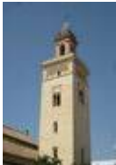
Iglesia de San Marcos.