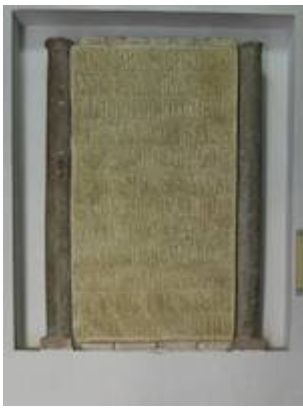
Lápida fundacional de las atarazanas (1253)