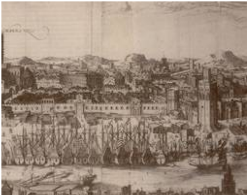
Vista del río Guadalquivir y del Arenal desde Triana (detalle de las Atarazanas). Johannes Janssonius (1617)