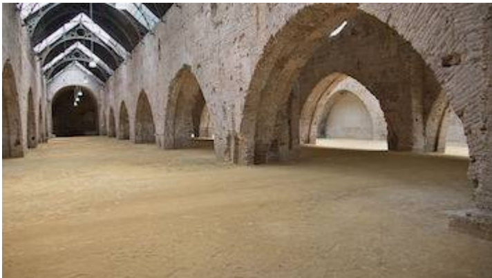
Atarazas reales (siglo XIII).