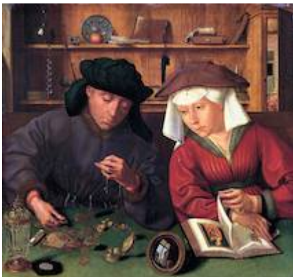
El cambista y su mujer . Quentin Matsys (1514)