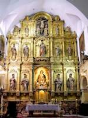
Altarpiece of the church of San Andrés (Baeza)