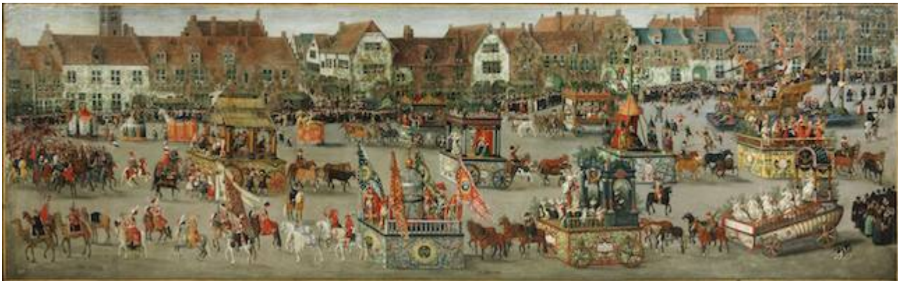
The Triumph of Isabella . Denis van Alsloot (1616)