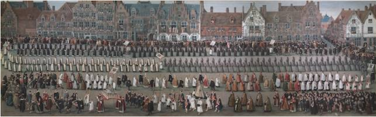
The procession of Our Lady of . Denis van Alsloot (1616)