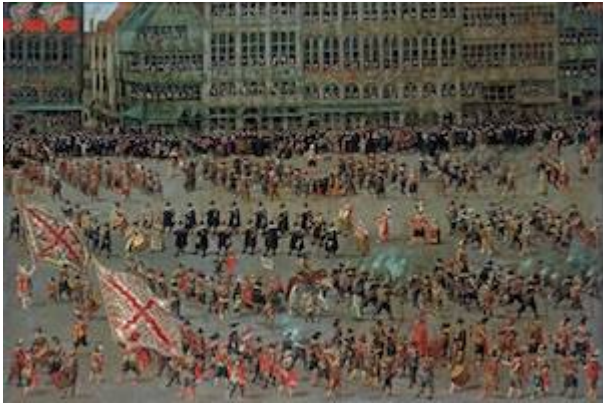
Desfile de los serments (1) . Denys van Alsloot (1615)