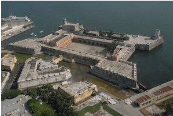
Fortress of San Juan de Ulúa