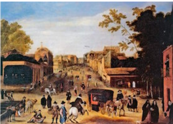
La carrera de San Jerónimo desde el Paseo del Prado . Anonymous (coleccion of the Marquis of Santa Cruz)