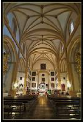
Inside of the church of La Encarnación in Íllora (Granada).