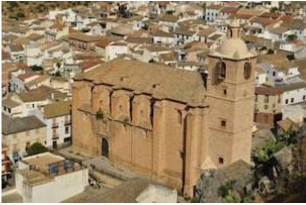
Church of La Encarnación in Íllora (Granada)