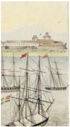
"La Compañía". Vistas de las Yslas filipinas y trages de sus abitantes . José Honorato Lozano (1847)