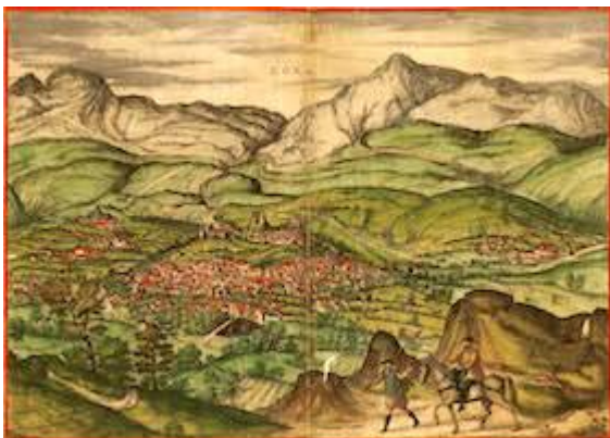
Loja (1564). Joris Hoefnagel. Georg Braun. Civitates Orbis Terrarum . vol. 2. Colonia, 1575