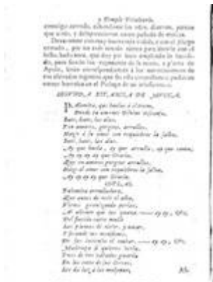
Segunda estancia de música