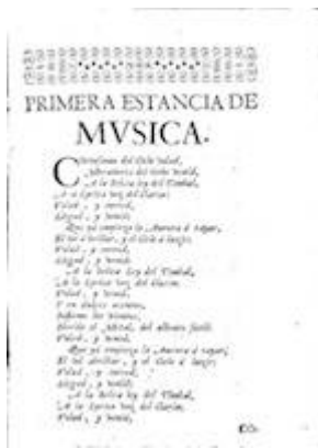
Primera estancia de música.