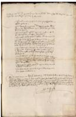
Condiciones con que se an de hazer los órganos de la capilla de Santo Elifonso