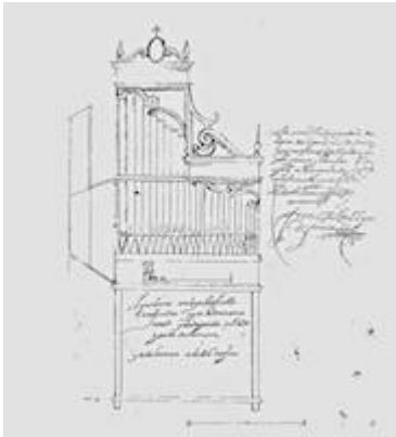
Design of an organ for the church of Santiago in Granada. Francisco Enrique de Porres (1614)