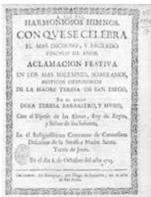
Harmoniosos himnos . Zaragoza: Diego Larumbe, 1713