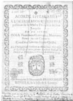
Acorde epitalamio. Zaragoza: Francisco Revilla, 1713