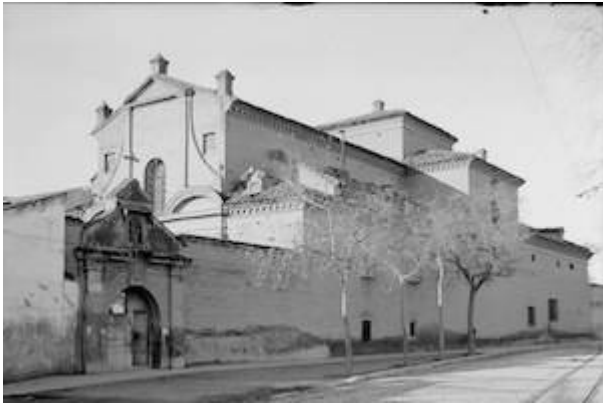
Convent of Santa Teresa. Picture by Fotografia de António Passaporte (1930)