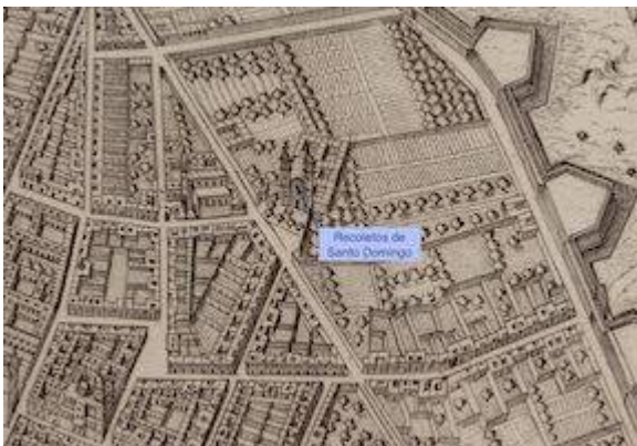
Recoletos de Santo Domingo. Plano scenographico de la Ciud. de los Reyes o Lima capital de los Reynos del Perú . Antonio de Ulloa, 1748