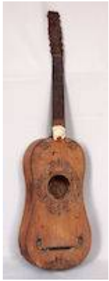
Vihuela Marianita. Quito, c. 1600.