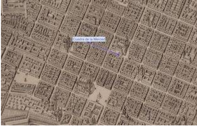
Cuadra de la Merced. Plano scenographico de la Ciud. de los Reyes o Lima capital de los Reynos del Perú . Antonio de Ulloa, 1748