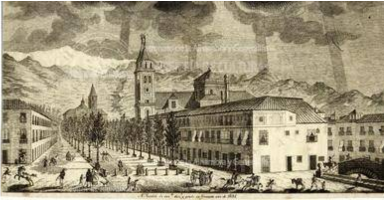
Church of Nuestra Señora de las Angustias. Description of the building and some historical facts