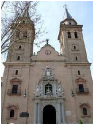
Facade of the church of la Virgen de las Angustias.