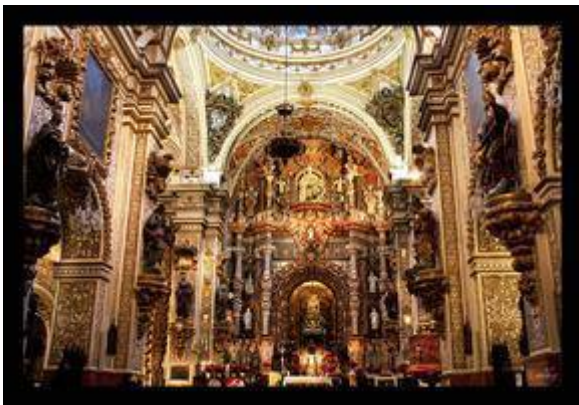
Interior of the church of la Virgen de las Angustia.