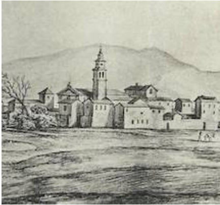
Collegiate church of Nuestra Señora de la Encarnación. Santa Fe. Viaje de Cosme de Médicis por España y Portugal (1668-1669) . Lorenzo Magalotti