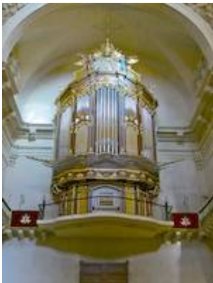
Organ of the church of Santa María (Elche). Gerhard Grenzing (2006)