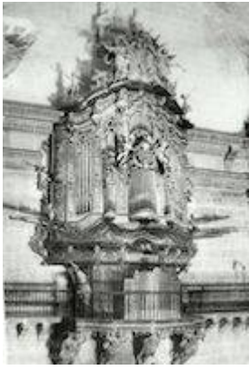
Organ of the church of Santa María (Elche). Leonardo Fernández Dávila. Picture by Pedro Ibarra y Ruiz (1902)