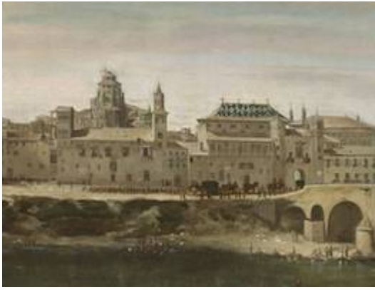
La Seo (Zaragoza cathedral)