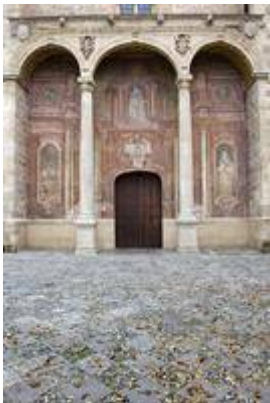
Convent of Santa Cruz la Real. Pictures by Beatriz Carmona Lozano