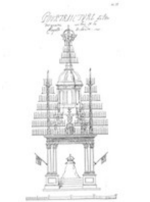
Catafalque of King Felipe II in the church of San Jerónimo (1598)