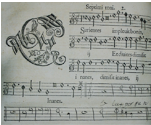
Canticum Beatae Mariae quod magnificat nuncupator . Francisco Guerrero, fol. 83v. Picture by Javier Marín López