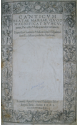
Canticum Beatae Mariae quod magnificat nuncupator (Lovaina: Pierre Phalèse, 1563).