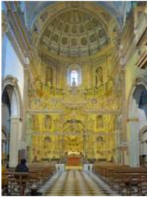
Sacra Capilla del Salvador