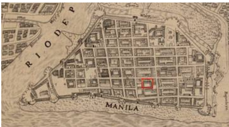
Convent of San Nicolás de Tolentino (1734)