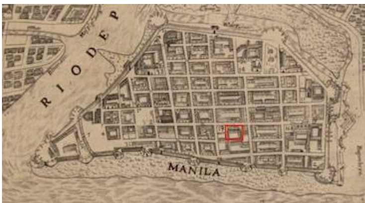
Convent of San Nicolás de Tolentino (1734)