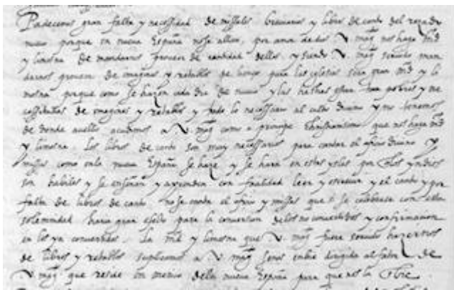
Letter from Fray Andrés de Aguirre to Felipe II (1581)