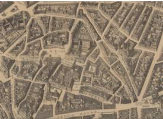
convent of Descalzas Reales. Plano de Pedro Texeira (1656)