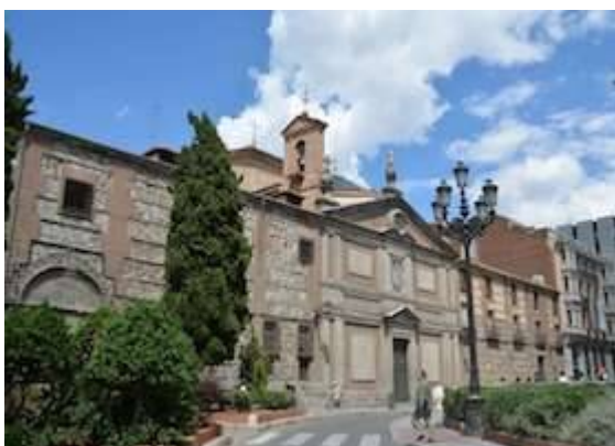
Descalzas Reales monastery