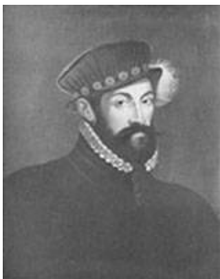
Juan de Borja