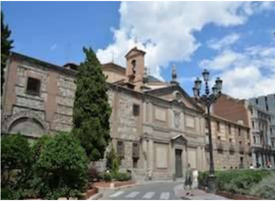
Descalzas Reales monastery