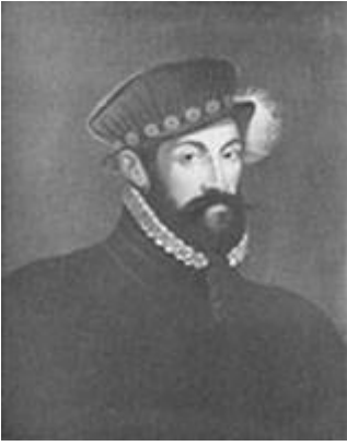
Juan de Borja