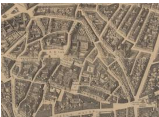
convent of Descalzas Reales. Plano de Pedro Texeira (1656)