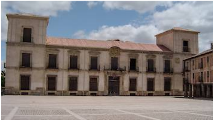
Ducal palace of Medinaceli