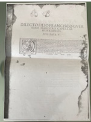
Letter from Pope Pio V. Liber primus missarum (Paris, 1565). [E-TE 01-002]