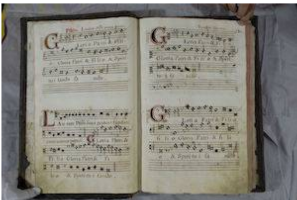
"Gloria Patri". Laudate Dominum omnes gentes . Francisco Guerrero. Libro de polifonía nº 3 de la catedral de Baeza [E-BAEc 3], fols. 9v-10r