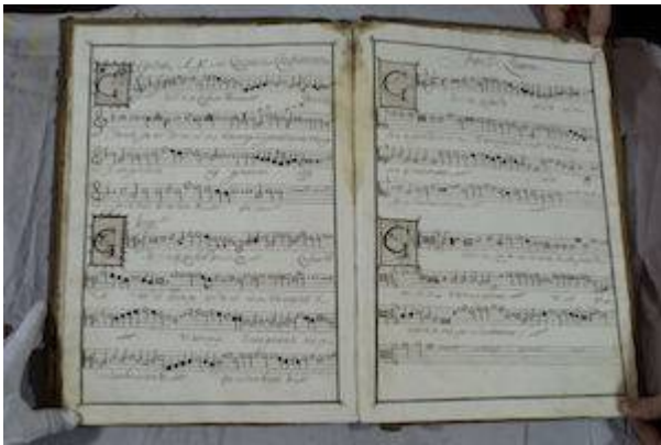
Gloriose confessor Domine . Francisco Guerrero. Libro de polifonía nº 1 de la catedral de Baeza [E-BAEc 1], fols. 46v-47r