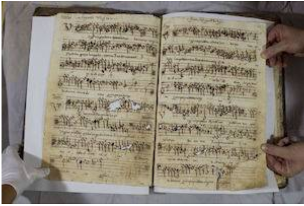
Virgines prudentes . Francisco Guerrero. Libro de polifonía nº 6 de la catedral de Baeza [E-BAEc 6], fols. 36v-37r

https://embed.spotify.com/?uri=https://open.spotify.com/track/58YIDOUc29rvH4GnZnbHEw?si=2hD_BkDARzSIUxM16EV7AQ