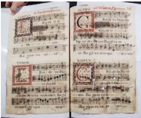
Crudelis Herodis . Francisco Guerrero. Libro de polifonía nº 2 de la catedral de Baeza [E-BAEc 2], fols. 24v-25r