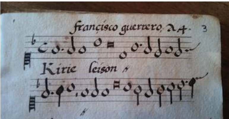
Mass L'homme armé a 4. Francisco Guerrero. E: Asa 2

"http://www.youtube.com/embed/sZfDurkw-9A?iv_load_policy=3&fs=1&origin=http://www.historicalsoundscapes.com"