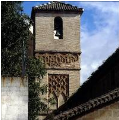
Church of San Juan de los Reyes. Description of the building and some historical facts