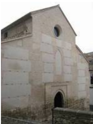
Church of San Juan de los Reyes.