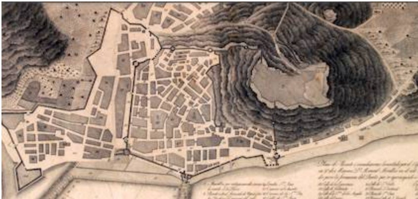
Map of Alicante. Manuel Miralles (1794 /1803)