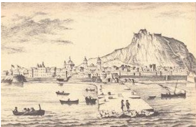
View of Alicante (18th century)