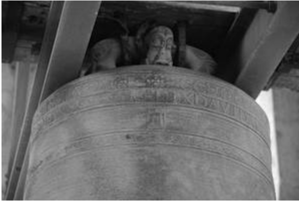
City Hall Clock Bell (1699)