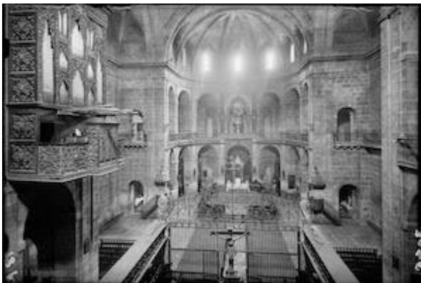
Collegiate church of San Nicolás de Bari [Loty-08046]