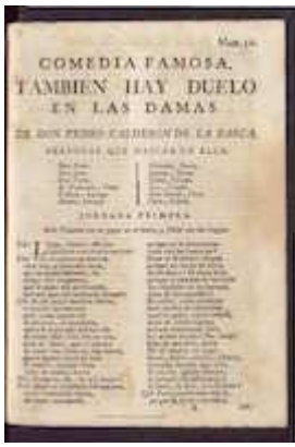
También hay duelo en las damas. Pedro Calderón de la Barca