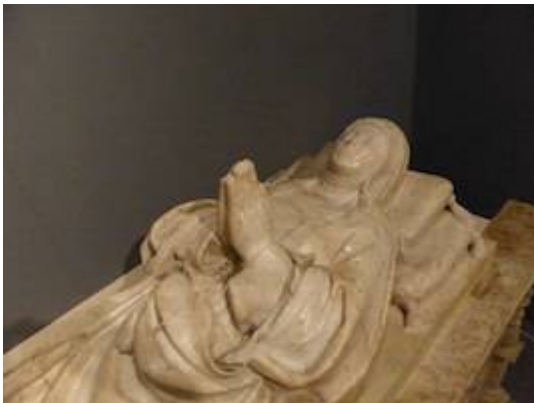
Recumbent sculpture of Beatriz Galindo