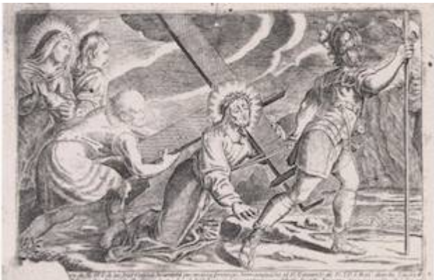
Our Father Jesus of the Three Falls (engraving 18th century)