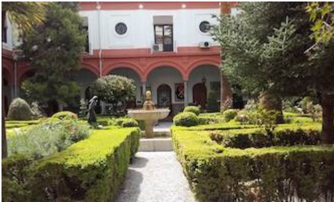
Convent of San Francisco Casa Grande.