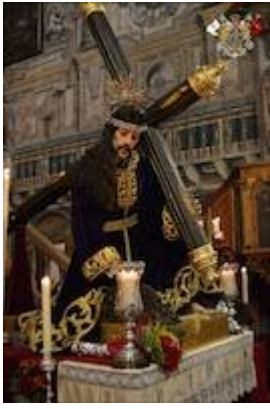
Our Father Jesus of the Three Falls (c.1683)