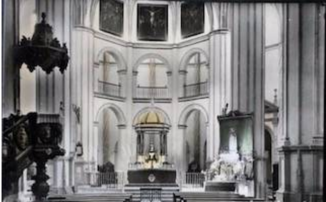
Collegiate church of La Encarnación in Baza (Granada)