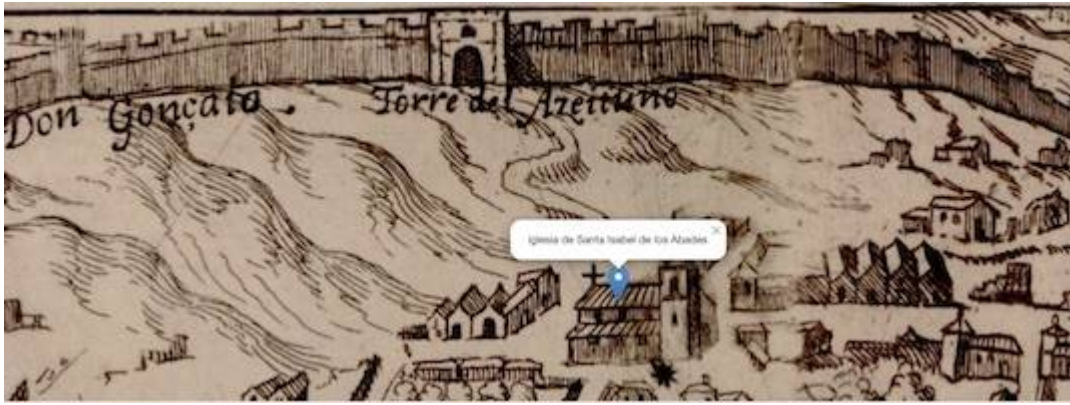
church of Santa Isabel de los Abades. Map of Ambrosio de Vigo