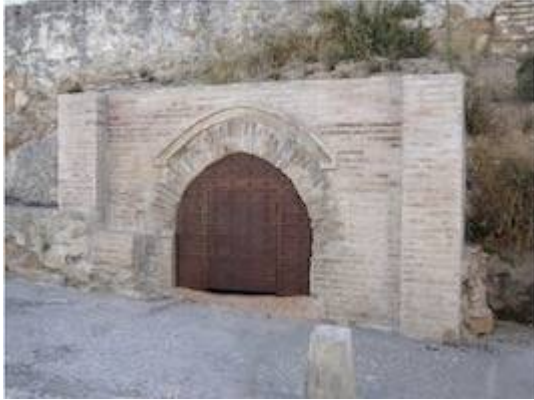
Cistern of Santa Isabel de los Abades