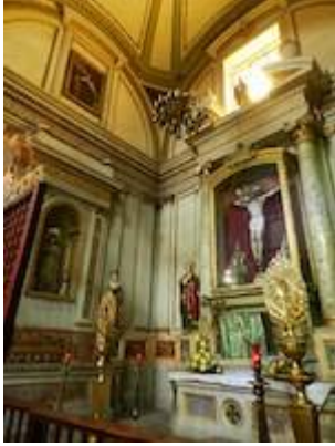
Chapel of El Señor del Buen Despacho. Mexico cathedral