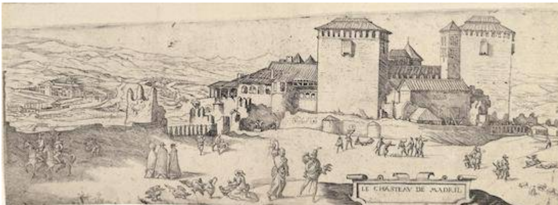
El Alcázar de Madrid. Jan Cornelisz Vermeyen (c. 1534)