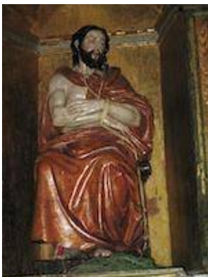
Jesus de las Burlas o de la Humildad (currently at the church of San Ildefonso)