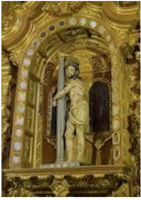
Jesús atado a la Columna (currently at the church of San Ildefonso)