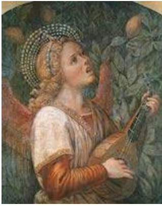
The angel musician. Melozzo da Forlì (1438-1494)