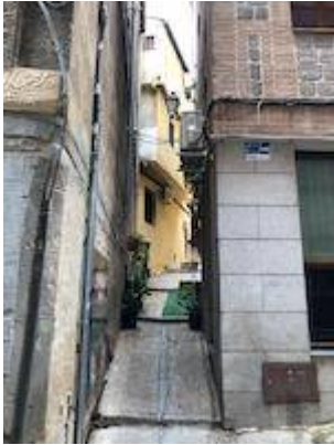
Old Lauderós street.