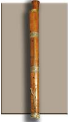
Dulcian. Cathedral of Jaca (Huesca). 17th century