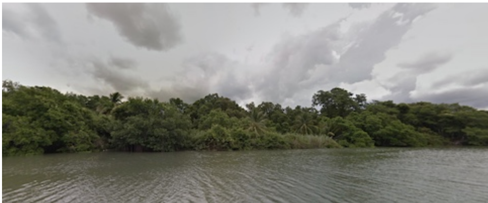
Surroundings of the approximate enclave of Santa María de la Victoria (Yucatán - Mexico)